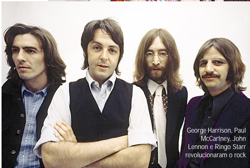
George Harrison, Paul McCartney, John Lennon e Ringo Starr revolucionaram o rock