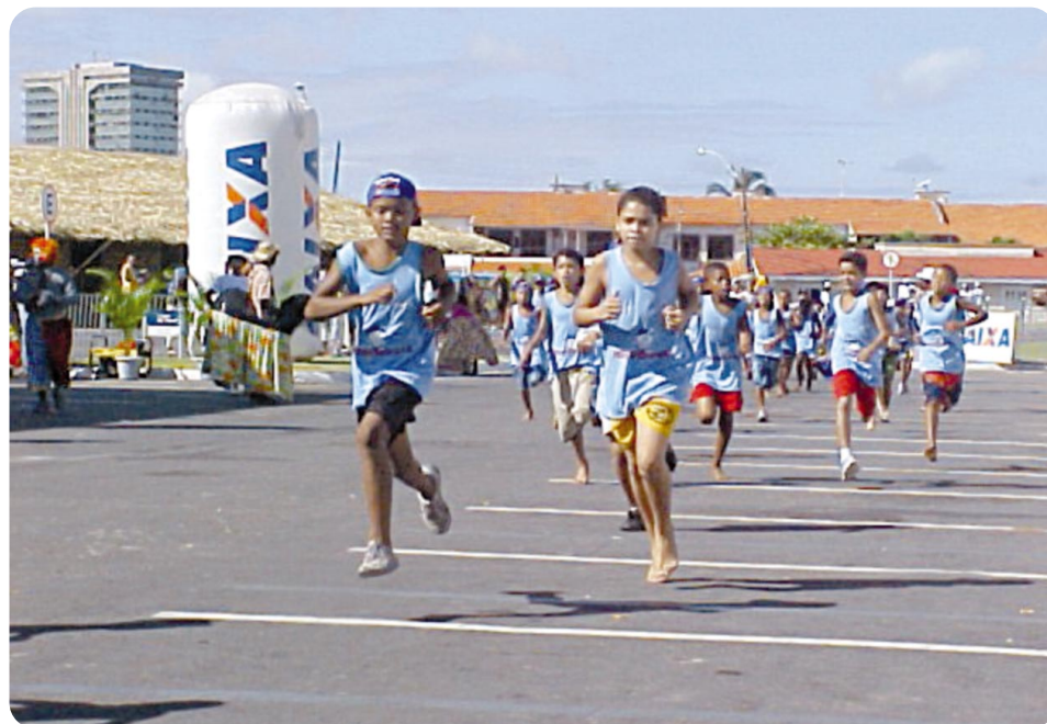
Competição em Tambaú também visa descobrir novos talentos no atletismo brasileiro

Divididas em categorias, de acordo com a idade (de 7 a 12 anos), as crianças precisam vencer um percurso de cerca de 300m. Há também uma bateria formada por crianças com necessidades especiais. O prêmio para os ven-