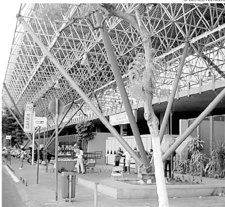
O evento terá como local o Espaço Cultural José Lins do Rego, na Capital

Do primeiro encontro, realizado em Salvador, no dia 6 de julho, participaram mais de 300 municípios, o que representa 72% dos 417 municípios