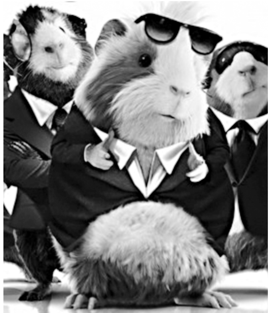
Porquinhos-da-Índia são as estrelas da animação 'Força G', em cartaz em Campina e Capital