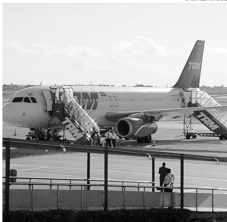
No 1º semestre, a TAM acumulou lucro de R$ 850,7 milhões, alta de 115%

No primeiro semestre, a TAM acumulou lucro de R$ 850,7 milhões, alta de 115% na comparação anual, também favorecida pelo resultado financeiro. De janeiro a junho,