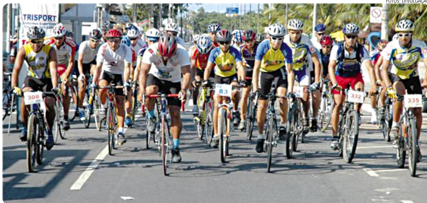
Competição de hoje na Capital é ainda dentro das comemorações dos 424 anos. De acordo com a organização, a prova começa às 8 horas

Será desclassificado da prova, o atleta que contrariar qualquer norma do regulamento, utilizar-se de meio ilícito que lhe confira vantagens indevidas sobre os demais competidores e adotar qualquer tipo de conduta antidesportiva ou que venha a causar constrangimento a qualquer participante da prova ou a organização. Nestes casos, a organização reserva-se o direito de recusar a inscrição do atleta nas próximas edições do evento.