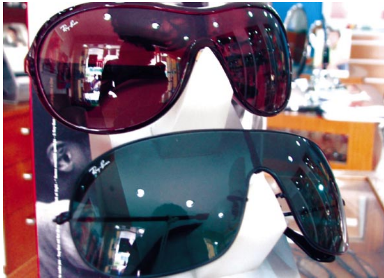
Uso de óculos vendido nas ruas exige cuidado por parte dos consumidores

Se não sair logo daquela situação e procurar uma sombra para descansar a vista, logo vão surgir dores de cabeça, mal